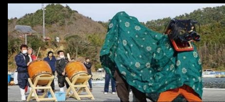
Shishi-mai at a village destroyed by 3.11, 2011 The Great East Japan Earthquake, Onagawa-town in Miyagi prefecture