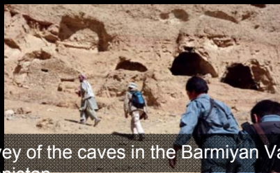
Survey of the caves in the Bamian Valley in Afghanistan