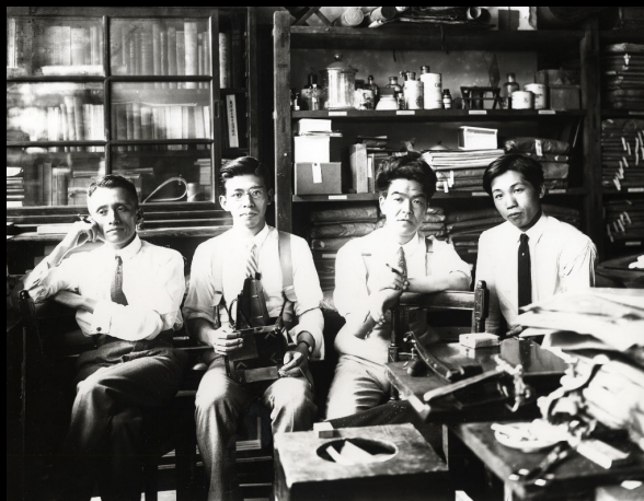
Member of the Institute of Art Research