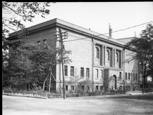
The Institute of Art Research