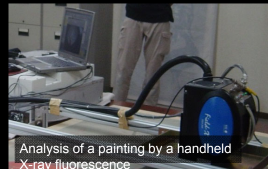
Analysis of a painting by a handheld X-ray fluorescence