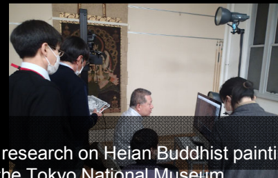
Joint research on Heian Buddhist paintings with the Tokyo National Museum