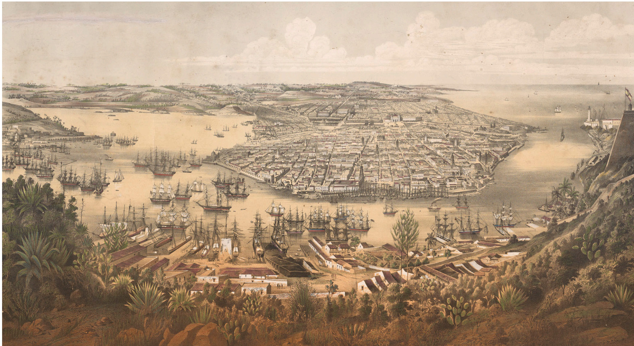
Eduardo Laplante (French, 1818–1860). La Habana: Panorama general de la ciudad y su bahía (Havana: Panorama of City and Bay), ca. mid-1850s, lithograph, 22 1/2 x 34 1/4 in. Los Angeles, Getty Research Institute, P840001.

Entre 1830 y 1930 las ciudades latinoamericanas experimentaron un rápido crecimiento y unos cambios sociopolíticos que dieron como resultado modificaciones a gran escala en el paisaje arquitectónico, generando las condiciones ideales para el surgimiento de la metrópolis.