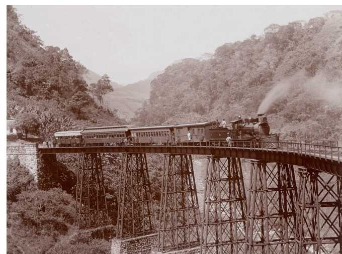
Charles Betts Waite (American, 1861–1927). Raymond Special on the Metlac Bridge , ca. 1897, gelatin silver print, 7 3/4 x 9 1/2 in. Los Angeles, Getty Research Institute, 96.R.143.1.

En el sur de California las nuevas identidades arquitectónicas híbridas, como el estilo misión y el revival español, emergieron desde una visión idealizada del pasado. Estos estilos se diseminaron rápidamente en Latinoamérica y con el tiempo pasaron a formar parte de un nuevo vocabulario vernáculo. Mientras, la creciente popularidad del mundo precolombino en las exposiciones universales así como el mayor interés en las culturas antiguas en el estudio de la arqueología, dieron como resultado la emergencia de un revival arquitectónico de estilo maya. En Los Ángeles algunos de los arquitectos más significativos que trabajaron en este lenguaje incluyen a Frank Lloyd Wright (1867–1959), su hijo Lloyd Wright (1890–1978), y Robert Stacy-Judd (1884–1975).