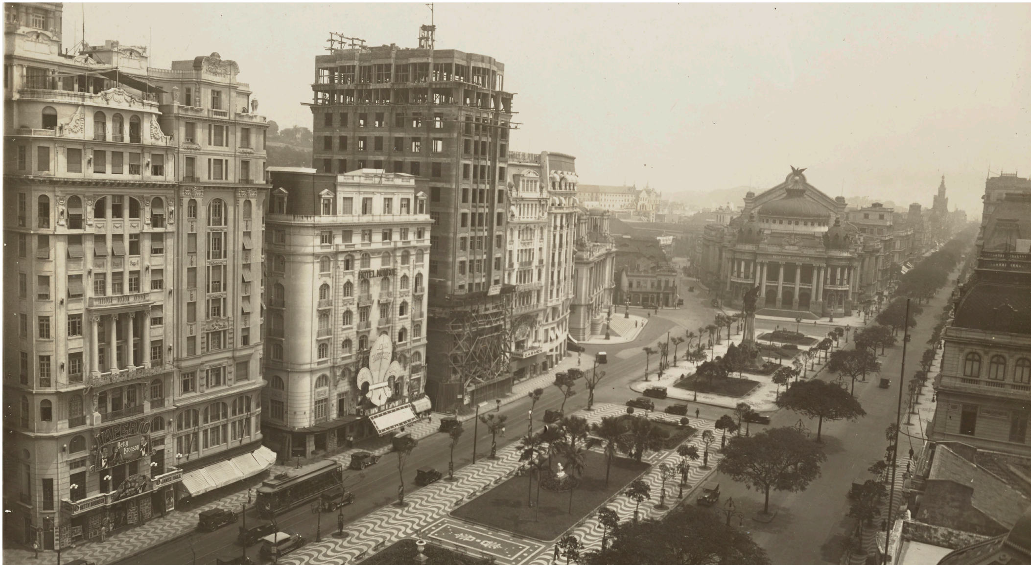
Augusto Cesar de Malta (Brazilian, 1864–1957). Praça Marechal Floriano , 1927, gelatin silver print, 7 x 9 1/4 in. Los Angeles, Getty Research Institute, 92.R.14.

Between 1830 and 1930, Latin American cities experienced rapid growth and sociopolitical changes that resulted in major modifications to city scale and architectural landscapes, creating ideal conditions for the emergence of the metropolis.