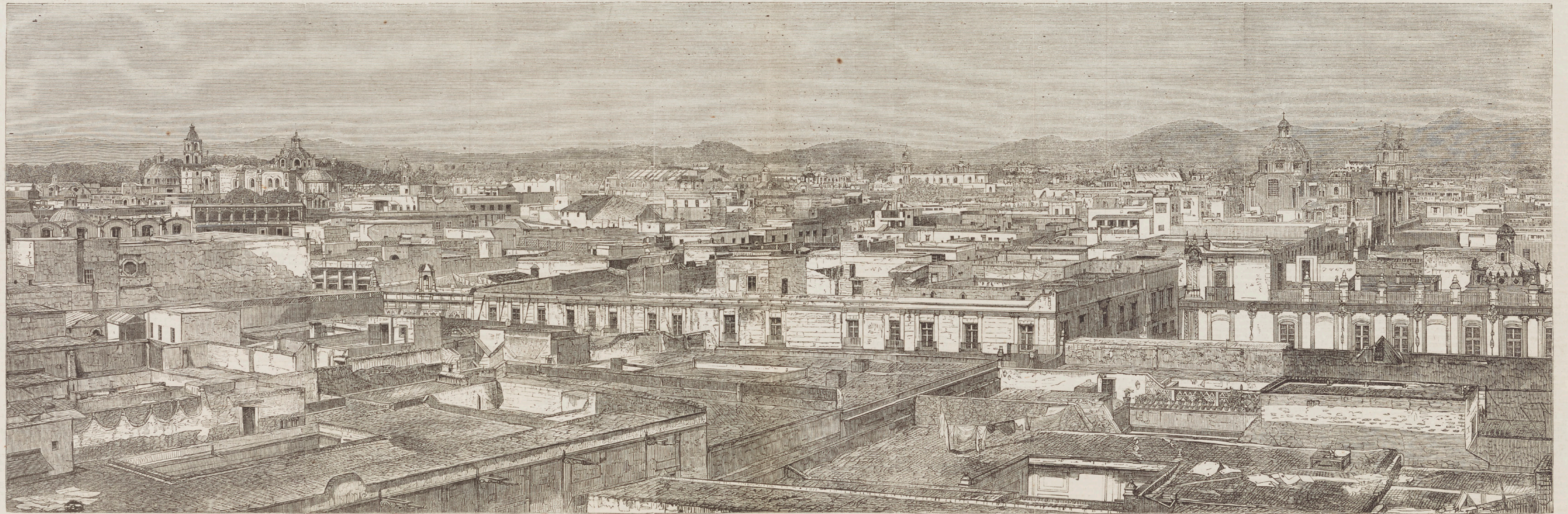
PANORAMA OF THE CITY OF MEXICO.—FROM PHOTOGRAPHS BY M. EDOUARD CHARNAY.—SEE SUPPLEMENT, PAGE 87.

William Luson Thomas (British, 1830-1900), after M. Edouard Charnay (French?, active 19th century). Panorama of the City of Mexico. Engraving in The Illustrated London News 42, no. 1184 (1863), n.p. Los Angeles, Getty Research Institute, P84000.